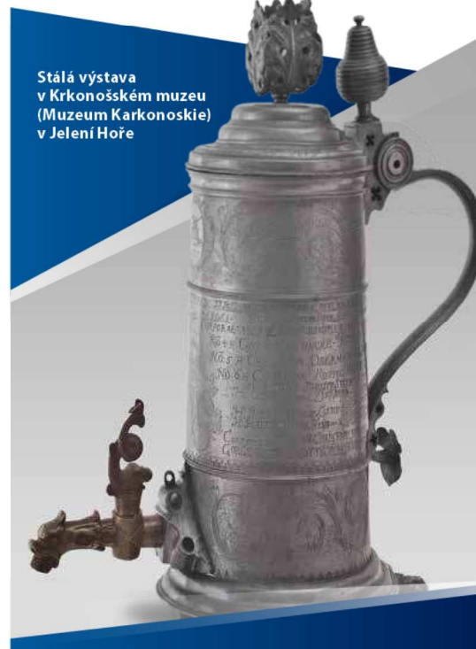
Stálá výstava v Krkonošském muzeu (Muzeum Karkonoskie) v Jelení Hoře