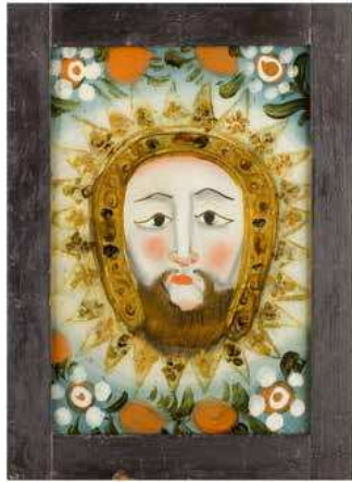
MANDYLION konec 18. st.

jako byly tesařství, truhlářství, bednářství, kolařství nebo kovářství. Ve filmu můžete také zhlédnout etapy obrábění lnu, k exponátům pak patří tkalcovské nářadí, látky, oblečení a čepce prezentované na figurínách. V pravé straně sálu spatříte barevný svět lidového umění těsně spojeného se sférou sacrum – jsou to obrazy na skle a sochy. Pyramidový betlém a pernikové formy se vážou ke svátečním obřadům. S životem vesnice devatenáctého století byli nerozlučně spojeni také laboranti – bylináři, lidoví lékárníci. Na výstavě se můžete podívat na skleněné fioly, lahve, velké konve a zásobní lahve, malované a popsané krabice ze stromové kůry, které sloužily