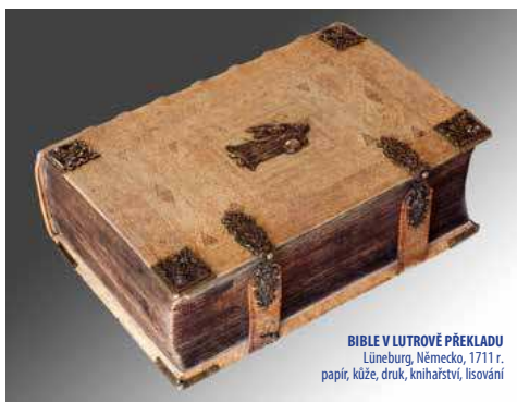
BIBLE V LUTOVÉ PŘEKLADU Lüneburg, Německo, 1711 r. papír, kůže, druk, knihařství, lisování

V další části expozice se dostanete do novověku, těsně do doby po třicetileté válce (1618–1648), která město zcela zničilo. Privilegium obchodu lněným plátnem, voalem, které v roce 1630 Jelení Hora získala, zajistilo městu rozkvět a také zapříčinilo rozvoj jiných řemesel. Působení Svazu kupců a obchod lněným plátnem, jenž byl na vysoké úrovni, byly pro město velmi důležité a z těchto důvodů byla v roce 1914 u muzea postavena miniatura měšťanského domu z hlavního náměstí. Výstavba domu měla odrážet bohatství a okázalost domů kupců-patricijů.