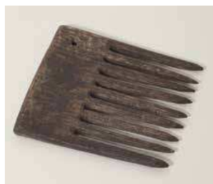
TKALCOVSKÝ HRĚBEN středověk Jelení Hora, ul. Krótká, průzkum záspyu studně díveo

Krkonošské muzeum vás zve na cestu po historické Jelení Hoře. Stálá výstava je zasvěcena dějinám, kultuře a umění města