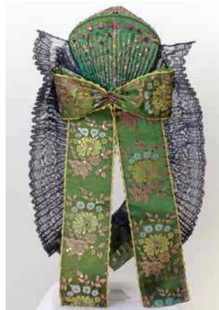
DVOUDÍLNÝ ČEPEK 2. pol. 19. století

Další expozice vás seznámí s dávnou i současnou lidovou kulturou jelenohorského území. Dávnou vesnickou kulturu, jež v důsledku historických proměn po roce 1945 zmizela, si můžete přiblížit během návštěvy venkovské chaty, která byla v muzeu postavena v roce 1914. Jednak roubená chata, která je příkladem podstávkového domu, jednak prezentace modelů domů stojících před ní vám umožní poznat krásu architektury tohoto území. V samotné chatě lze vidět charakteristické uspořádání a zařízení interiéru obytné části, bohatě polychromovaný nábytek a vybavení domu. Když se dostanete z chaty ven, vejdete do světa řemesel a lidového umění. V sále vlevo se můžete dozvědět něco o nejstarších a po nejdělsí dobu fungujících řemeslech na vsi,