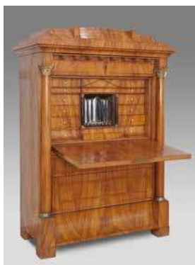
SEKRETÁŘ Slezsko, asi 1820 dřevo, zrcadlo, truhlářství, dyhování

V další části expozice se dostanete do novověku, těsně do doby po třicetileté válce (1618–1648), která město zcela zničilo. Privilegium obchodu lněným plátnem, voalem, které v roce 1630 Jelení Hora získala, zajistilo městu rozkvět a také zapříčinilo rozvoj jiných řemesel. Působení Svazu kupců a obchod lněným plátnem, jenž byl na vysoké úrovni, byly pro město velmi důležité a z těchto důvodů byla v roce 1914 u muzea postavena miniatura měšťanského domu z hlavního náměstí. Výstavba domu měla odrážet bohatství a okázalost domů kupců-patricijů.