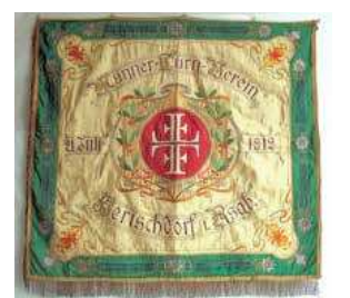
PRAPOR GYMNASIČKÉHO SPOLKU Z MALINNIKU, 1912 r. hedvábí, atlasová vazba, výšivka

řezbářské školy (Szkoła Snycerska) v Cieplících. Celek expozice uzavírají dějiny Krkonošského spolku, jeho sbírky a popis aktivit, včetně historie Krkonošského muzea. Další část výstavy se týká dějin města po 2. světové válce a ukazuje problém poválečného osídlování Jelenohorské kotliny. Tuto tematiku zobrazují filmy o městě a této kotlině.