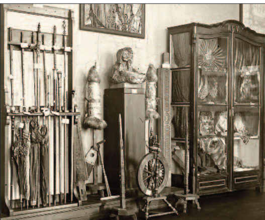
Část původní etnografické expozice v 1. patře muzea

Nastalý problém s nutností rozšíření parcely severním směrem, kde pozemky vlastnil stavitel Lange, byly vyřešeny diplomaticky: RGV bylo umožněno pozemky odkoupit s podmínkou, že muzeum bude stavět firma Langeho syna. Stalo se tak, projekt byl 30. prosince 1911 schválen i předsednictvem spolku. Co chybělo, to byl dostatek financí na stavbu. Spolek uspořádal rozsáhlou sbírku, důležité dárce objížděl sám H. Seydel (prostředky na krkonošskou chalupu nakonec věnoval hrabě Schaffgotsch); nakonec se podařilo shromáždit 65 000 marek. Stavební práce započaly 3. června 1912, nečekané komplikace (odstranění skal, nutnost drenáží) nastaly hned při stavbě základů z janovické žuly, pak ale stavba rostla rychle – již v listopadu téhož roku byla pod střechou, v zimě pokračovaly práce uvnitř, muzeum bylo už tehdy vybaveno např. nízkotlakým parním vytápěním, na jaře byly provedeny nástěnné malby podle projektu berlínského malíře, profesora Oetekera. Od jara 1913 rostly také přístavby – zděný kupecký dům podle vzoru dvou jelenohorských měšťanských kamenic a roubená chalupa z podkrkonošské vsi. Ta byla stvořena složením více vzorů a vybavena typickým nábytkem a vybavením,