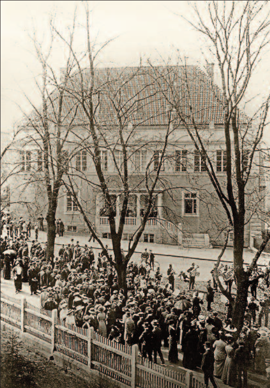
Slavnostní otevření muzea 14. 4. 1914 Pověšiměte si jiné uspořádání vstupu do budovy