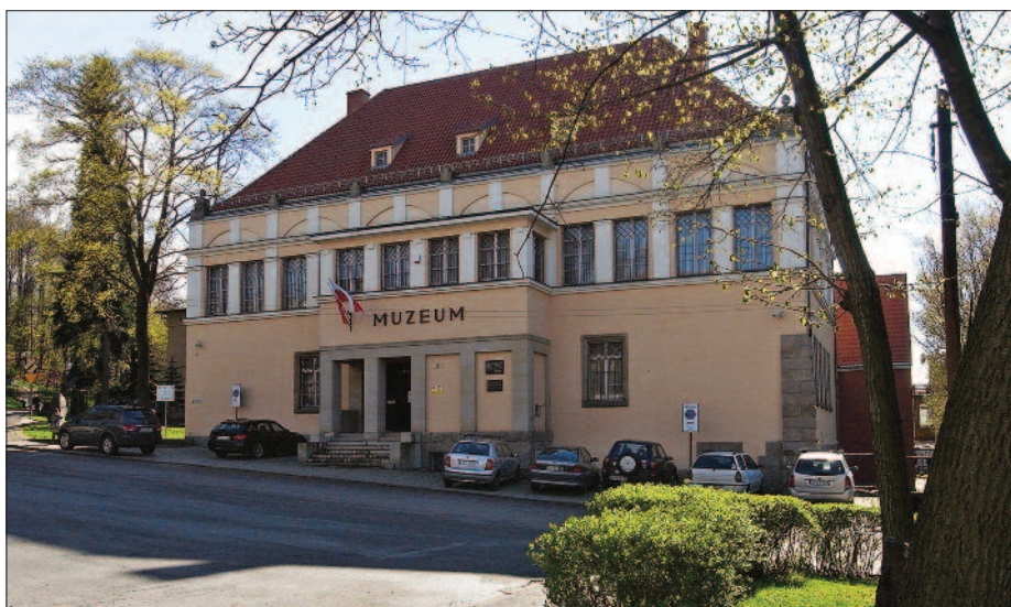
← Muzeum Karkonoskie v Jeleniej Górze 14. 4. 2014 – v den stého výročí svého otevření